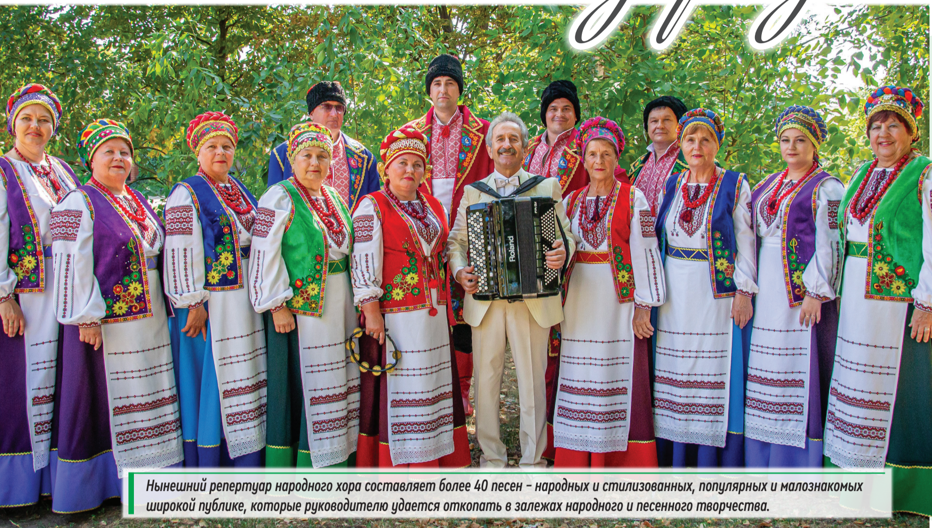
Нынешний репертуар народного хора составляет более 40 песен – народных и стилизованных, популярных и малознакомых широкой публике, которые руководителю удается откопать в залежах народного и песенного творчества.

Надо отметить, что новопсковский коллектив мастерски исполняет ряд хорошо известных и полюбившихся слушателям песен из богатого и разнообразного репертуара академического Кубанского хора. Одна из них – старинная казачья песня «Ой, при лужку, при лужке» в обработке В. Захарченко – прозвучала в фестивальной программе «Слобожан». Интересно, что эта композиция приглянулась публике еще в 60-е годы минувшего века, когда впервые зазвучала веселой, бодрой мелодией с большого экрана в популярной советской кинокомедии «Свадьба в Малиновке». Вот такой «кульбит» совершило это песенное творение во времени и пространстве! – Кроме того, согласно регламенту фестиваля мы представили на суд жюри еще две композиции – заборную казачью песню «Ехали казаки домой» (музыка и слова Елены Верховской). Кстати, ее также исполняет один из кубанских коллективов – хор Краснодарской филармонии имени Григория Пономаренко. В этой песне запекает мужская группа нашего хора, – отметил Владимир Андрущенко. – И проeramную песню «Калина красная» (музыка Якова Френкеля, слова народные) очень проникновенно, чувственно, эмоционально исполнила женская группа хора. Причем это произведение прозвучало а капелла, то есть без музыкального сопровождения, что особенно важно и сложно в хоровом пении.