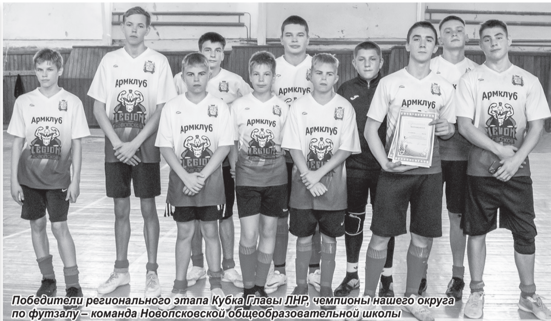
Победители регионального этапа Кубка Главы ЛНР, чемпионы нашего округа по футзалу – команда Новопсковской общеобразовательной школы

В минувшую пятницу в спортзале Новопсковской ДЮСШ прошли состязания регионального этапа Кубка Главы Луганской Народной Республики по футзалу, участие в которых приняли учащиеся старших классов общеобразовательных школ района. В то же время эти соревнования стали не только смотром юных спортивных талантов, но и первенством округа по футболу под крышей, открыв зимний сезон футбольных игр в зале.