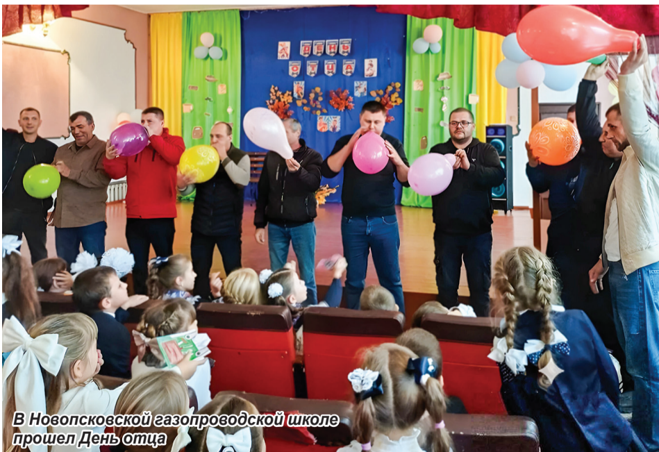
В Новопсковской газопроводской школе прошел День отца

Отряды Булавиновской основной школы «Союз отзывчивых сердец – SOS», «Четверочка», «Комета», «Патриот» изготовили памятные медали для своих отцов, тем самым выразив им свою любовь и благодарность. А