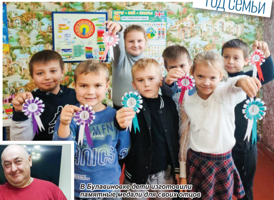
В Булавиновке дети изготовили памятные медали для своих отцов