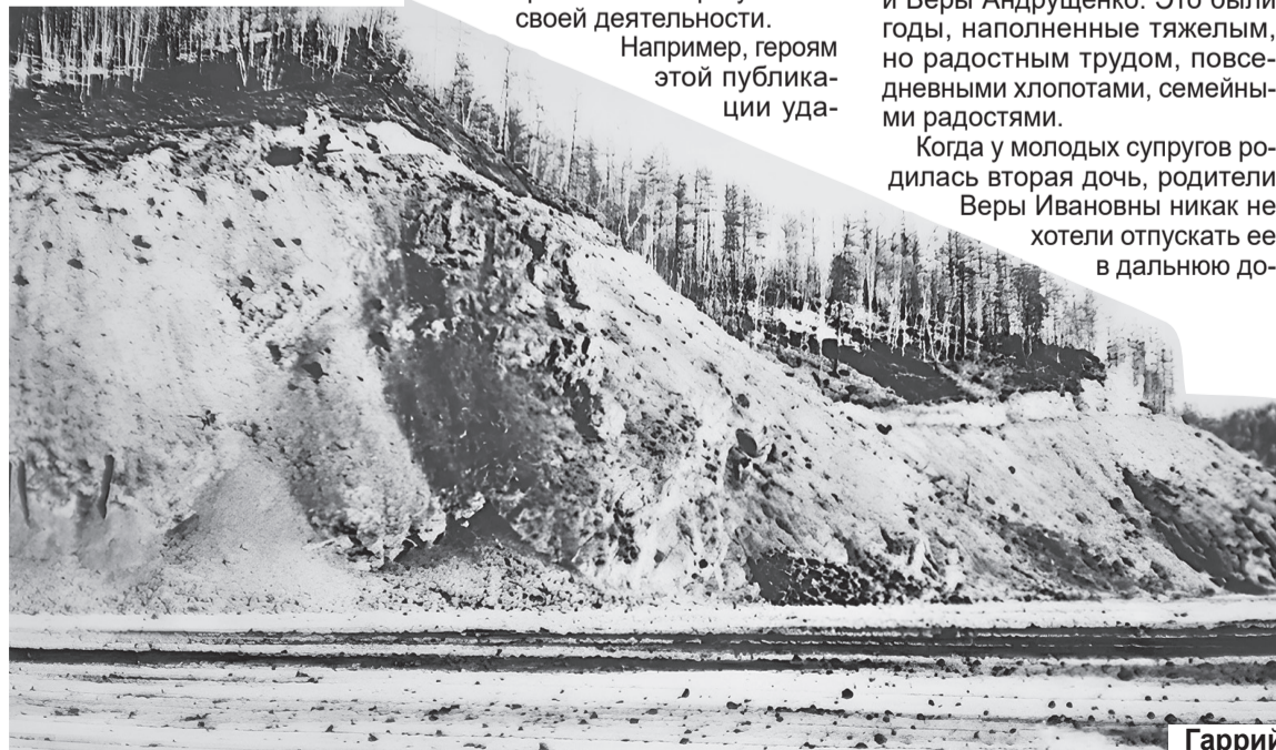
Гаррий ВЛАСЮК, фото из семейного архива супругов АНДРУЩЕНКО

– Бамовский период был лучшим временем нашей жизни! Самым насыщенным, ярким, запоминающимся. Несмотря на то, что были напряженная работа, вполне объективные трудности, непривычная, сложная обстановка, тяжелые климатические условия, мы были счастливы! Нас окружали такие же молодые люди, как мы, – смелые, задорные, веселые, и это придавало силы, дарило ту живительную энергию, которая сохранилась на долгие годы. БАМ – это навсегда!