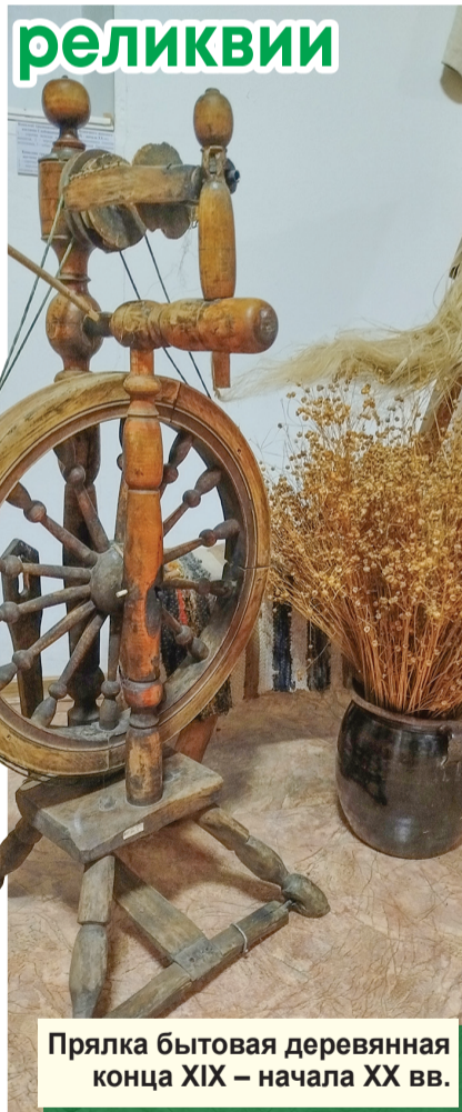
Прялка бытовая деревянная конца XIX – начала XX вв.

В нашем музее собрано множество увлекательных экспонатов. История каждого из них – бесценное прошлое нашего народа. Так, 4 декабря 1990