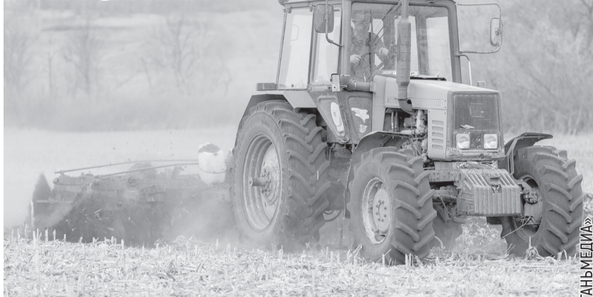
Озимыми зерновыми уже засеяно около двух тысяч гектаров.

– Всего же под урожай-2025 планируют засеять почти 260 тысяч гектаров – на 7 % больше, чем в прошлом году, – рассказал руководитель ЛНР. – Посевная озимых – это важный этап для аграрного сектора региона, ведь основной урожай зерновых приходится именно на озимые. Это связано с холодостойкостью сортов, а еще с возможностью использовать больше влаги для роста растений после таяния снега. Кстати, семена перед посевом прошли апробацию в Луганском филиале «Россельхозцентра». Нужна она для того, чтобы выбрать наиболее качественное и жизнеспособное зерно, которое сможет выдержать сложные кли-