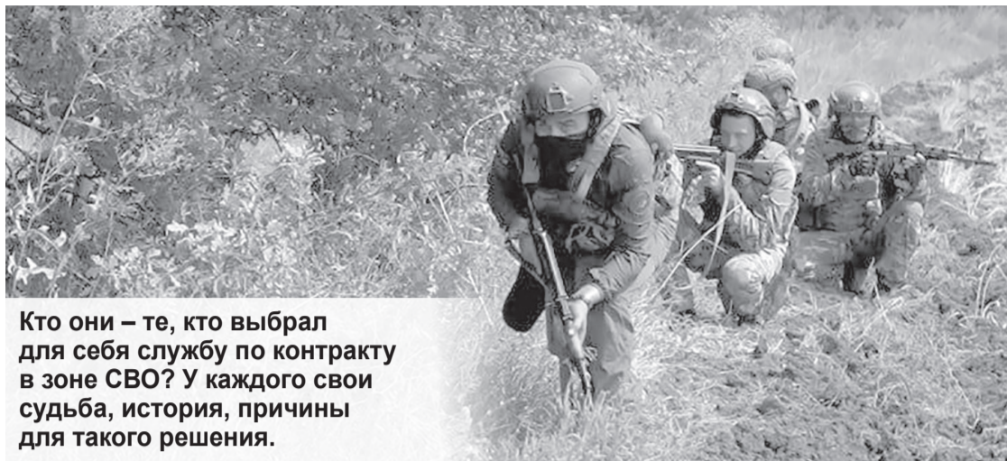
Кто они – те, кто выбрал для себя службу по контракту в зоне СВО? У каждого своя судьба, история, причины для такого решения.

Многие из тех, кто сейчас воюет в зоне СВО, часто до этого бывали в Донбассе с гуманитарной миссией. А с началом спецоперации решили: хватит надеяться на других! Среди них боец отряда специального назначения «Рысь» с позывным Хомяк: «Есть силы, способности, определенные знания, и все это может и должно принести пользу и защиту стране и ее гражданам».