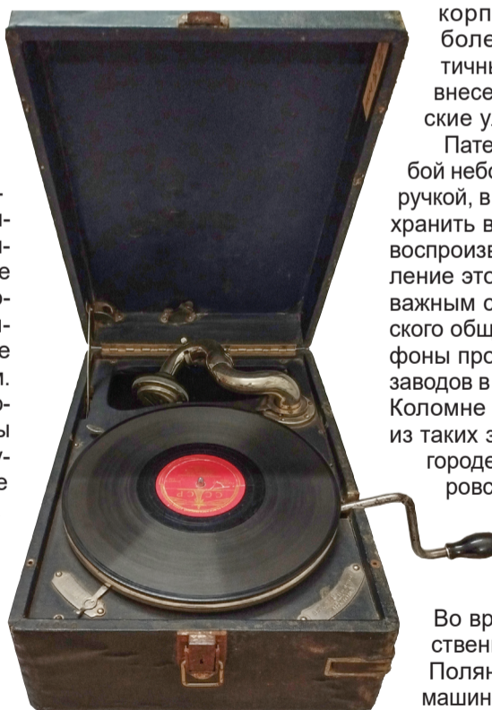
Патефон «Вятские поляны» 1940-х годов

До появления первого граммофона «Молот» меломаны уже могли оценить устройство для воспроизведения звука – фонограф. Он был изобретен в 1877 году. Патефон же был изобретен в 1901 году одним из сотрудников компании