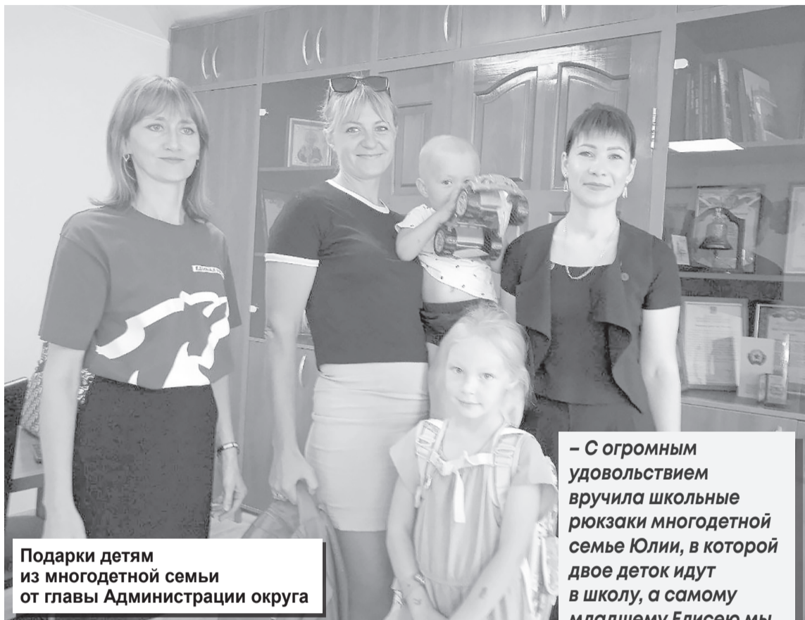
Подарки детям из многодетной семьи от главы Администрации округа

Стремительно приближается 1 сентября – знаковый день, когда в школах пройдут торжественные линейки и прозвучат трели первого звонка. А вместе с ним грядут и новые школьные хлопоты. О том, какие мероприятия проводились накануне этого неординарного события, – в нашем материале.