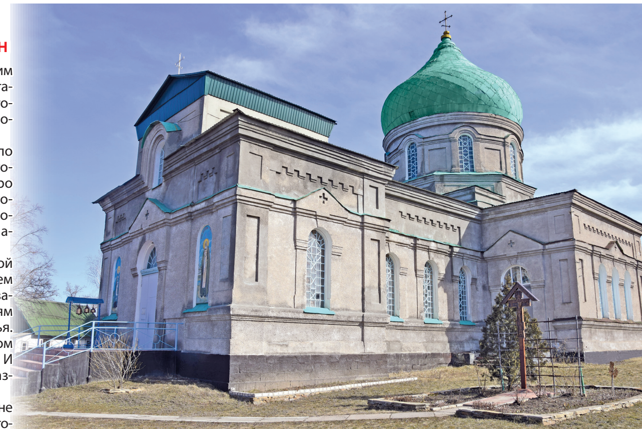
Подготовили Марина ПЛУГОВА, Давид МАТКАСИМОВ

Если вам будет интересно, прихожане расскажут и другие удивительные истории, связанные с этим святым местом.