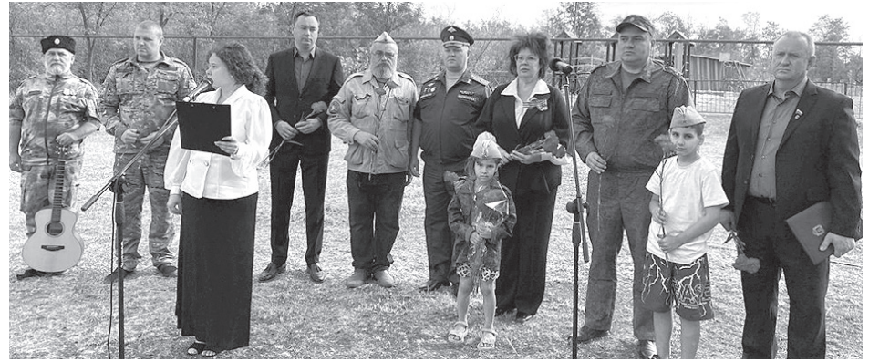
В завершение церемонии прогремел выстрел памяти в честь погибших воинов, и участники митинга возложили цветы и венки к могиле солдат.

После заупокойной молитвы состоялся ритуал перезахоронения. Останки воинов были торжественно уложены в могилу, на которой установили памятный знак. Присутствующие почтили светлую память героев Великой Отечественной войны минутой молчания.