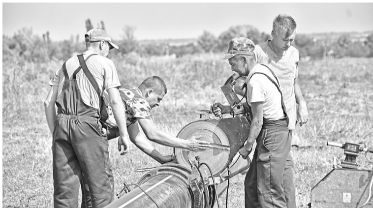
Специалисты Лутугинского участка Южного управления ГУП ЛНР «Лугансквода»