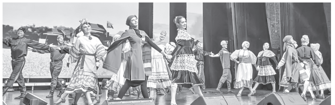
Народный ансамбль танца «Рапсодия» – визитная карточка Луганщины

– На Всероссийском фестивале народного творчества и традиций встречаются самобытные исполнители со всей страны под девизом «Многонациональная семья России». С 2022 года фестиваль проходит одновременно в двух регионах. Сегодня в прямом эфире гала-концерта прозвучат песни и мелодии народов Северного