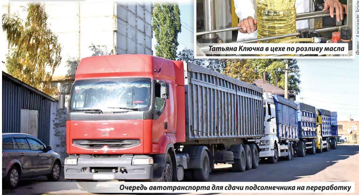
Очередь автотранспорта для сдачи подсолнечника на переработку