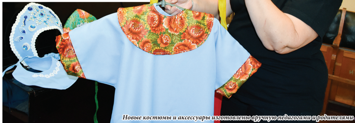
Новые костюмы и аксессуары изготовлены вручную педагогами и родителями.

Она отмечает, что дыхательные упражнения нужны не только для того, чтобы правильно и красиво говорить, но и для укрепления здоровья. О том, насколько занятия в