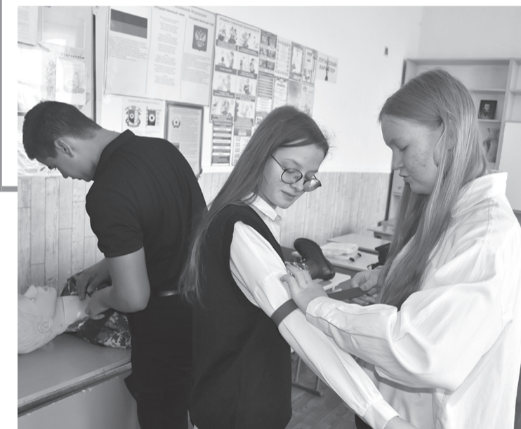
Благодаря новому оборудованию ребята с интересом участвуют в практических занятиях ОБЗР

Рабочая программа основ безопасности и защиты Родины разработана Министерством просвещения РФ для изучения правил безопасности в определенных ситуациях, угрожающих жизни и здоровью, также этот школьный курс призван обучить детей начальной военной подготовке.