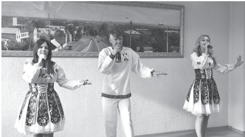
Солисты Дворца культуры выступили в честь Дня народного единства

В большом зале Администрации городского округа город Ровеньки состоялся праздничный концерт, посвященный Дню народного единства. Со сцены в исполнении солистов Дворца культуры имени М. Горького прозвучали песни о Родине, России и любви.