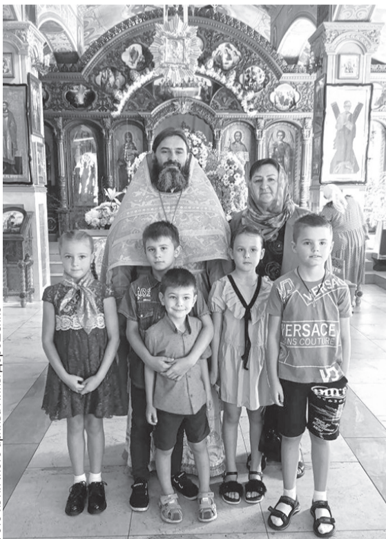
Ученики 2 «Б» класса в Свято-Никольском храме

Сотни писем, подарков, гостинцев уже отправлено на передовую. Встречи, беседы с теми,