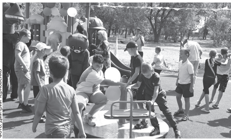
Игровой комплекс в поселке Дзержинском

В преддверии нового учебного года в нашем муниципалитете состоялось одно из самых значимых мероприятий для детей и их родителей. Сразу в двух населенных пунктах открылись новые игровые площадки.