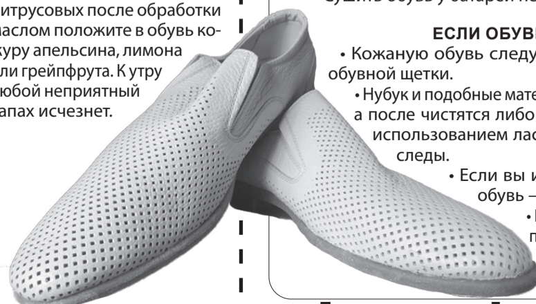
Полосу подготовил Дмитрий Терновенко