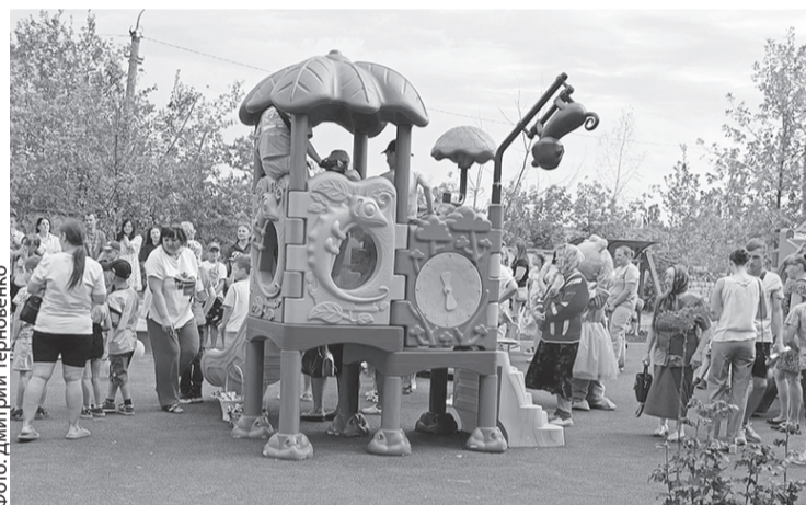
Открытие площадки в Ясеновском

Для детей радостное событие продолжилось развлекательной программой с участием любимых мультипликационных персонажей, которую организовал коллектив Дворца культуры имени Горького.