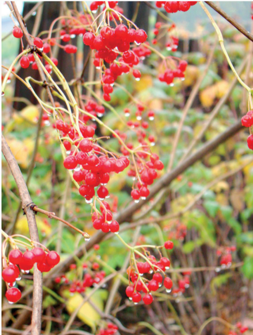
Фото Александра Черкашина, 55 лет