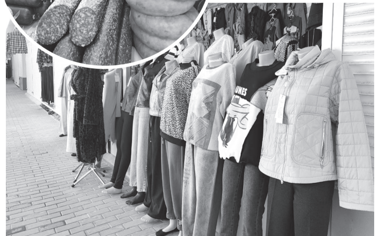
Полосу подготовила Маргарита Ленских

Гордостью руководителя предприятия являются и более двухсот смонтированных новеньких современных МАФов (малых архитектурных форм). Это специальные модули для торговли промышленными товарами, разместившиеся на площади порядка 2 тыс. квадратных метров. Совместно с предпринимателями производится и благоустройство рынка. Красивой тротуарной плиткой уже выложено 2,5 квадратных метра его территории.