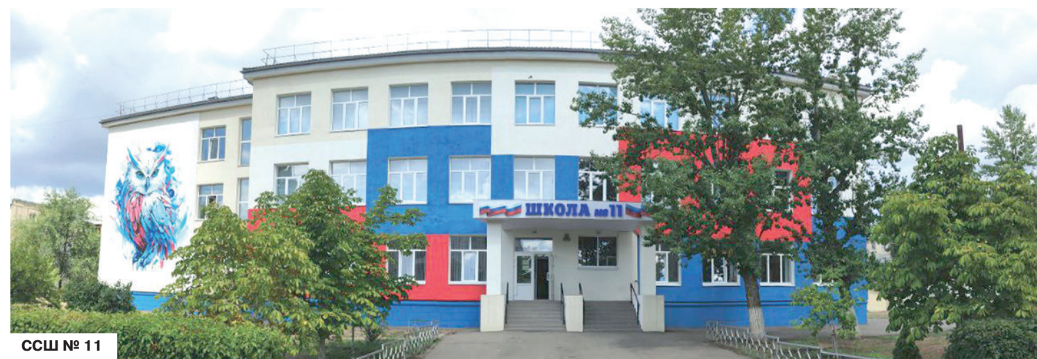
ССШ № 11

В школьную программу 1–9-го классов возвращаются уроки труда, которые будут включать в себя множество различных модулей. Помимо привычных кулинарии, кройки и шитья, столарного дела, в рамках этого предмета будут учить также управлять дронами («Введение в технологии беспилотных летательных аппаратов»), изучать азы робототехники.