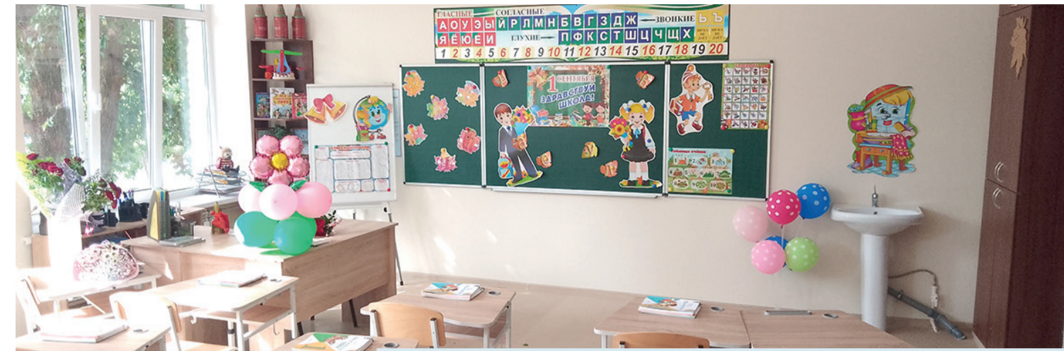
Новые кабинеты ССШ № 6

– Сколько первоклассников в этом году сядет за парты наших школ? Давайте сравним этот показатель с прошлогодним.