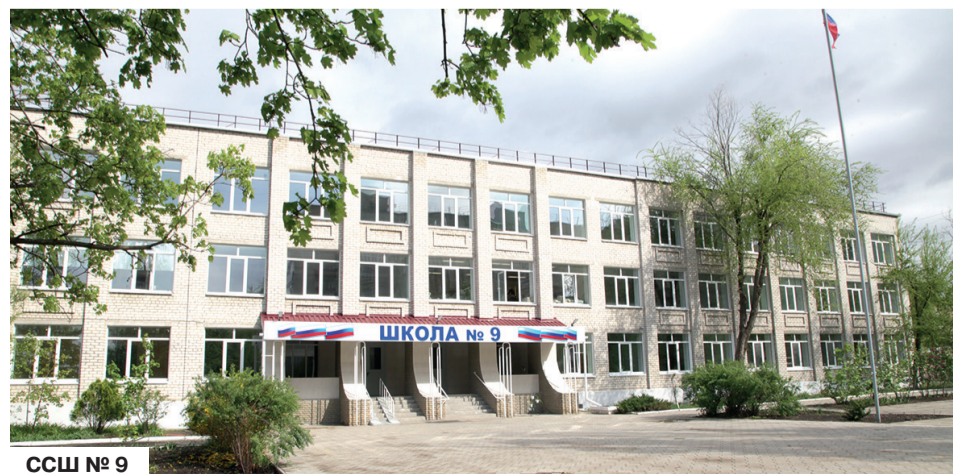
ССШ № 9

В этом учебном году отлично пополнилась и материальная база наших детских садов. Тут также – компьютерная техника, холодильники, сплит-системы, пылесосы, водонагреватели, микроволновые печи, металлодетекторы.