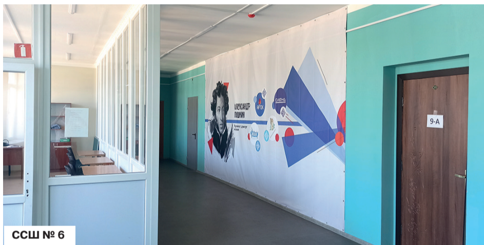
ССШ № 6

Не забыть, конечно же, и Северодонецкий центр патриотического воспитания, туризма и краеведения. Его материальная база пополнилась 40 единицами оргтехники.