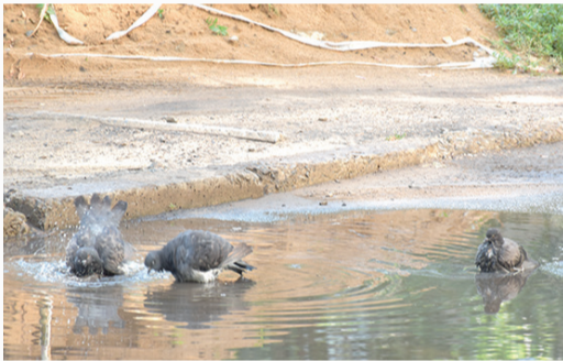
Автор стихотворения Виктор Квитко

А они купаются беспечно, Принимая душ из сочных брызг. Обрати вниманье, человек, Кажется, устроились навечно, И глядит на них, любуясь, вись.