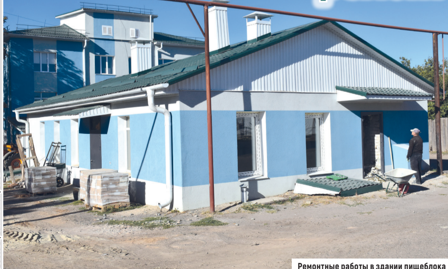
Ремонтные работы в здании пищеблока

Одновременно с ремонтом поликлинического отделения Белокуракинской центральной районной многопрофильной больницы продолжается ремонт здания пищеблока.