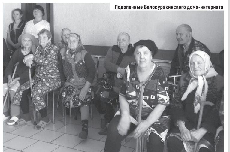
Подопечные Белокуракинского дома-интерната