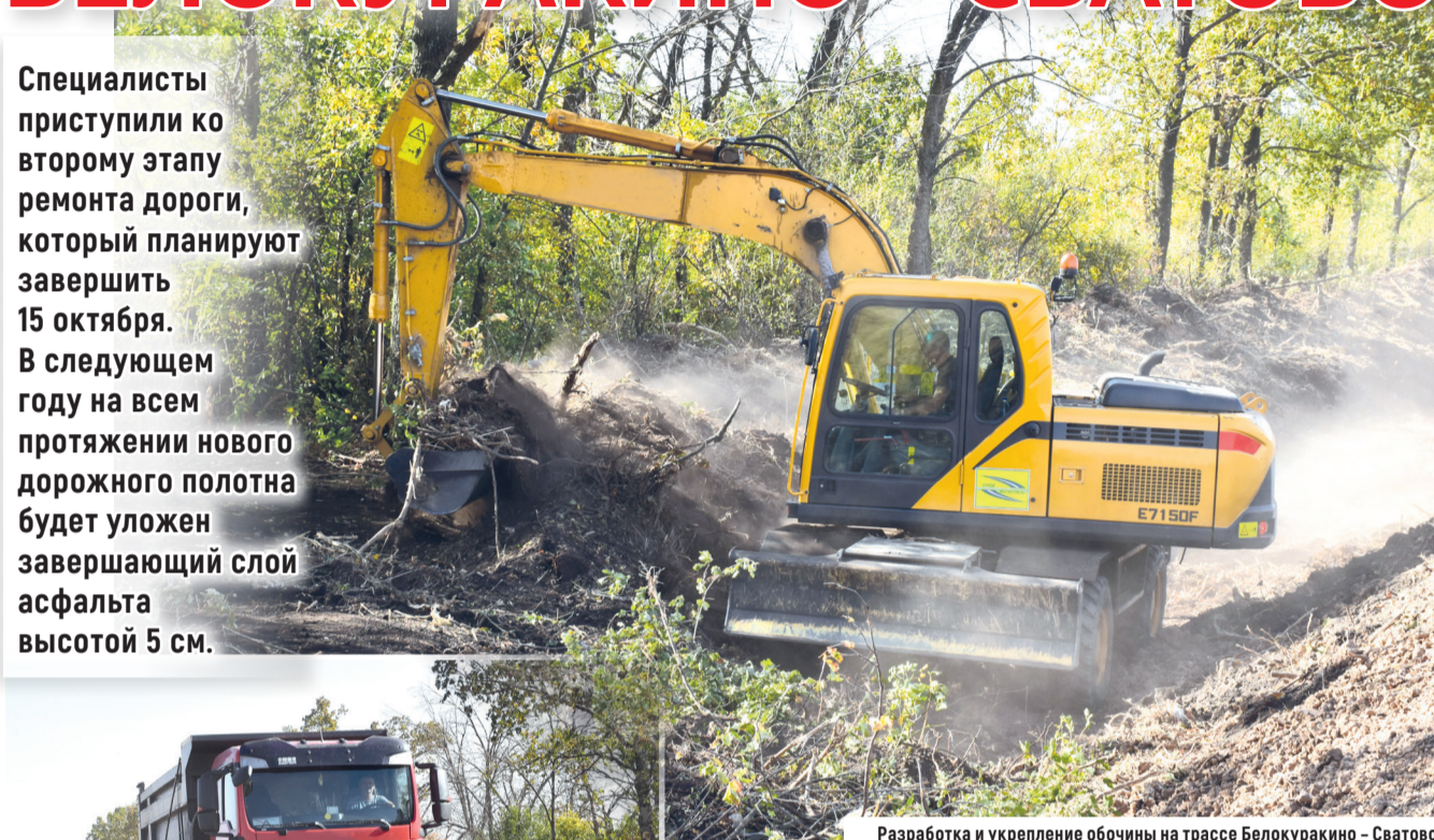
Разработка и укрепление обочины на трассе Белокуракино – Сватово

Специалисты приступили ко второму этапу ремонта дороги, который планируют завершить 15 октября. В следующем году на всем протяжении нового дорожного полотна будет уложен завершающий слой асфальта высотой 5 см.