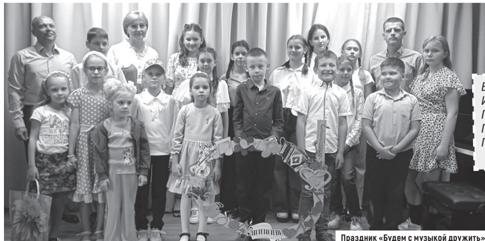
Праздник «Будем с музыкой дружить»