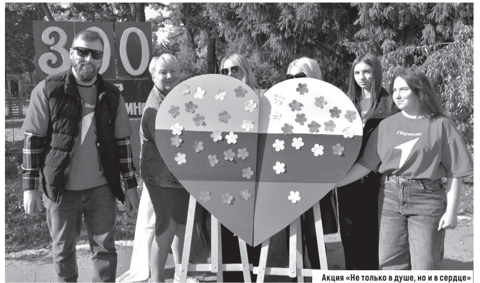
Акция «Не только в душе, но и в сердце»