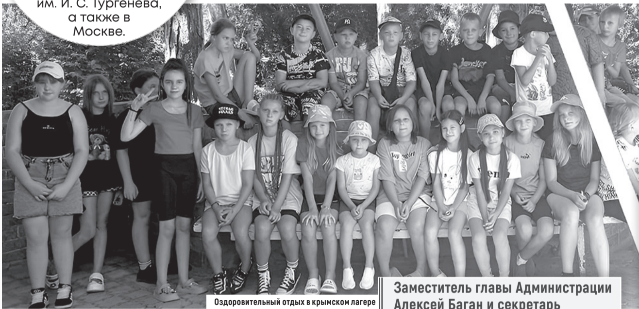
Оздоровительный отдых в крымском лагере