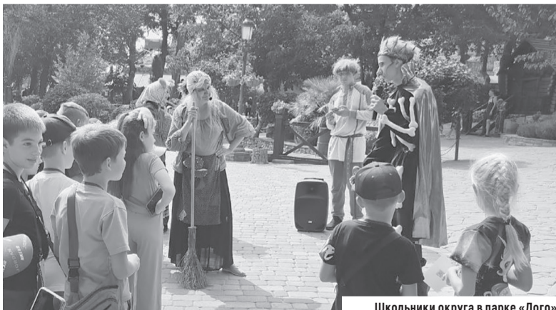
Школьники округа в парке «Лого»

Парк «Лого» уникален еще тем, что здесь созданы собственные мастерские: столярная и кузнечная, а также деревообрабатывающий цех. Дети с интересом наблюдали за работой мастеров и даже смогли принять участие в некоторых мастер-классах.