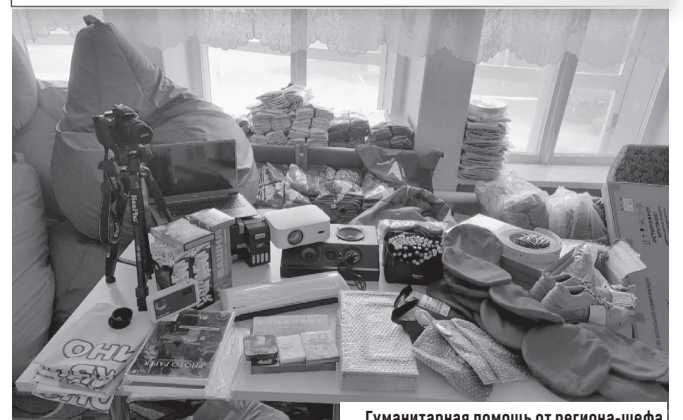
Гуманитарная помощь от региона-шефа

– Хочу сказать спасибо всем, кто принял участие в организации помощи. Для нас данная инициатива не просто средства или вещи, а вклад в будущее округа. Благодаря участию региона-шефа мы сможем реализовать большое количество идей и инициатив, которые помогут сделать жизнь нашей молодежи интереснее и ярче.