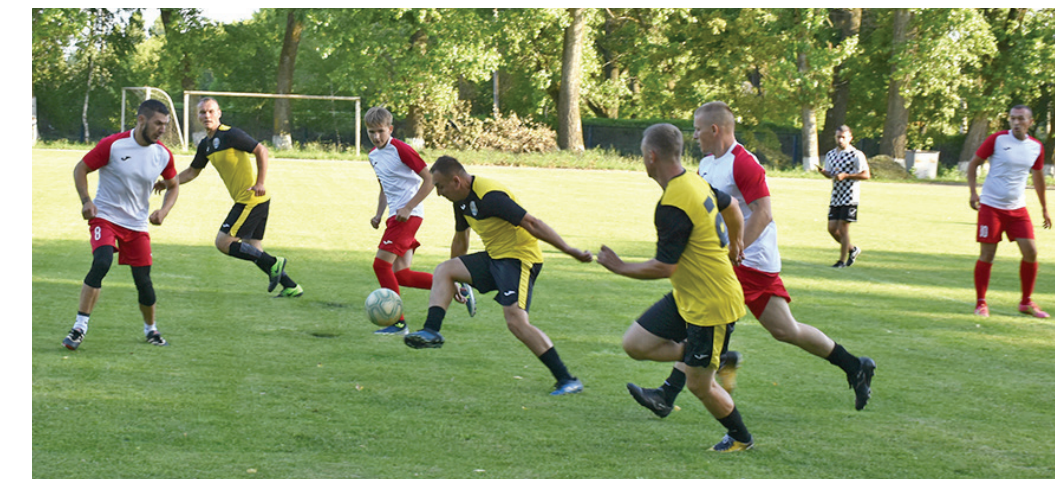
Подготовила Оксана ШЕВЧЕНКО

Основным местом почитания памяти бесстрашных героев является братская могила красных комиссаров, советских воинов и памятный знак в честь воинов-земляков, погибших в годы Великой Отечественной войны. Здесь же горит неугасаемый Вечный огонь, напоминающий о народном подвиге и ценности мира на земле.