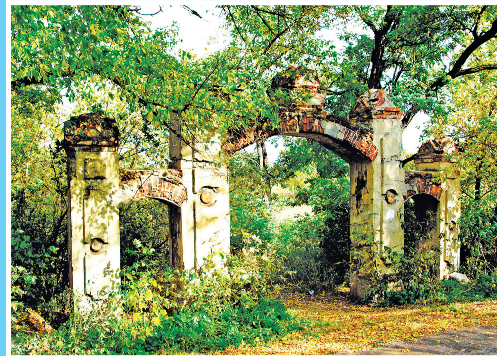
«Графские развалины» (руины усадьбы помещика Юрьева) в поселке Юрьевке