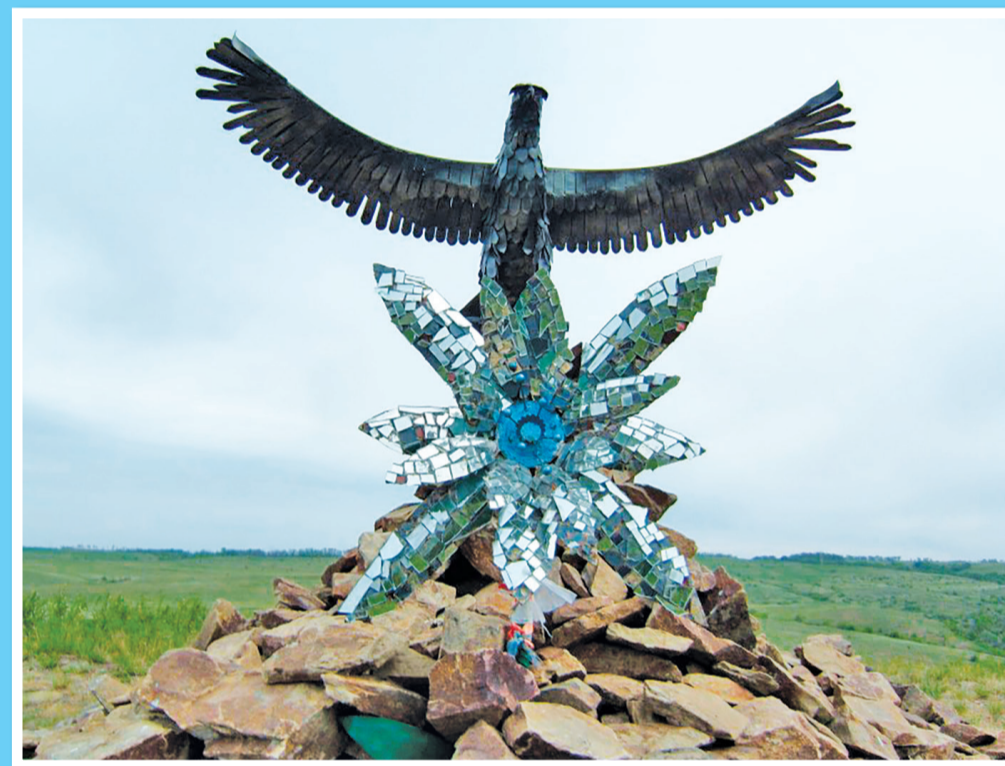
Монада инь-ян, выложенная из камней, кованный орел и цветок эдельвейс в селе Первозвановке