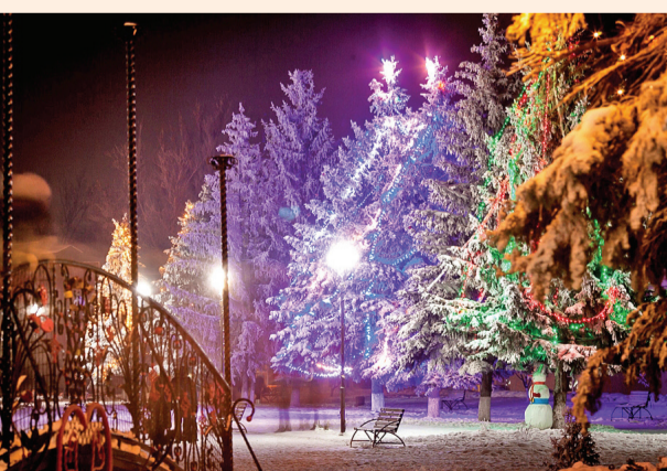
► Елки в праздничном убранстве. Они прекрасны и днем, и вечером, и среди сугробов, и в малоснежную зиму. Даже сейчас, в мае, глядя на них, чувствуешь щипающий за щеки мороз, запах мандаринов, надежду на перемены к лучшему – настоящую новогоднюю атмосферу...