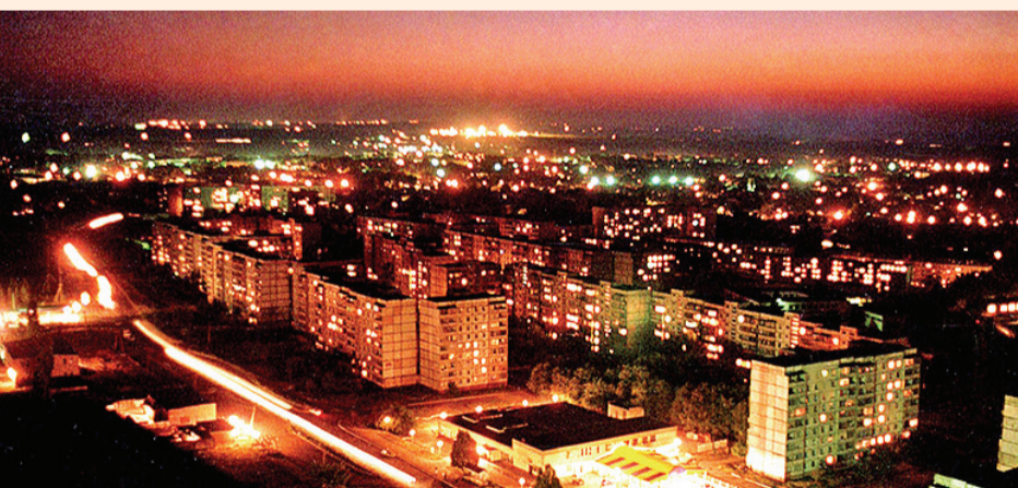
► Ночной город, запечатленный с высоты, поражает обилием огней. Окна свердловских домов и уличные фонари сияют ярко и уверенно. Имеют право, чего уж там. Вполне возможно, что когда-нибудь наш маленький Свердловск сможет соперничать светом с огромными мегаполисами...