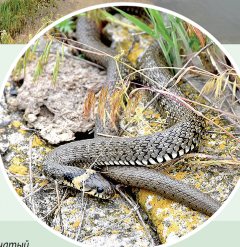
► Из пресмыкающихся здесь встречаются полозы – желтобрюхий, сарматский и узорчатый, ящерицы, гадюка степная, медянка обыкновенная, уж обыкновенный и водяной. Посмотрите, какой замечательный провальский ужик выполз взглянуть на прибывших в гости работников пера и клавиатуры!