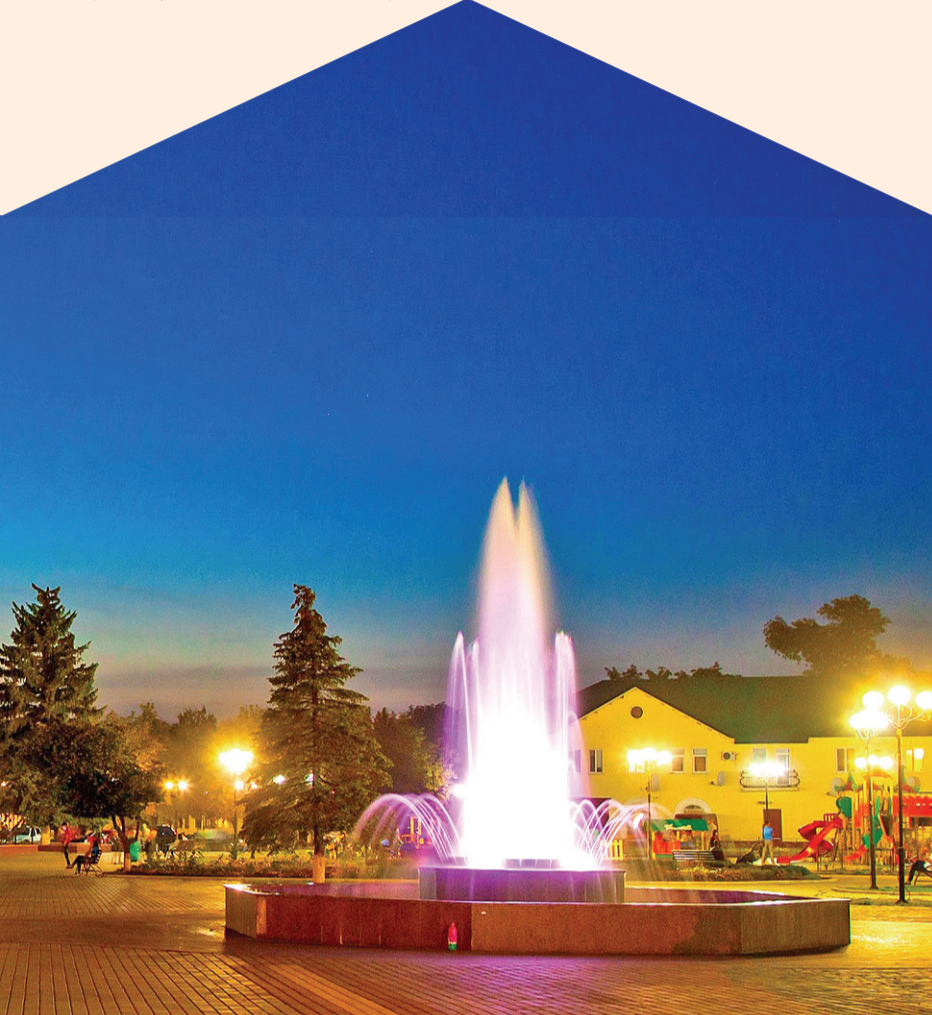
► Шахтерский сквер – настоящая достопримечательность Свердловска. Днем к услугам жителей и гостей города замечательные детские площадки, скамейки для отдыха, возможность полюбоваться клумбами, коваными фигурами и оградениями. А теплым летним вечером можно гулять по широкой площади и наблюдать за фонтаном.

Свердловск – город небольшой, но уютный, западающий в сердце каждому, кто прогулялся по его центру. В любое время суток здесь можно встретить что-нибудь интересное – главное, держать глаза открытыми и уметь замечать красоту в привычных, знакомых с детства вещах. Фотограф Владимир Шимаров это умеет. Его работы демонстрируют Свердловск с другой – вечерней – стороны. И поверьте, тут есть на что посмотреть!