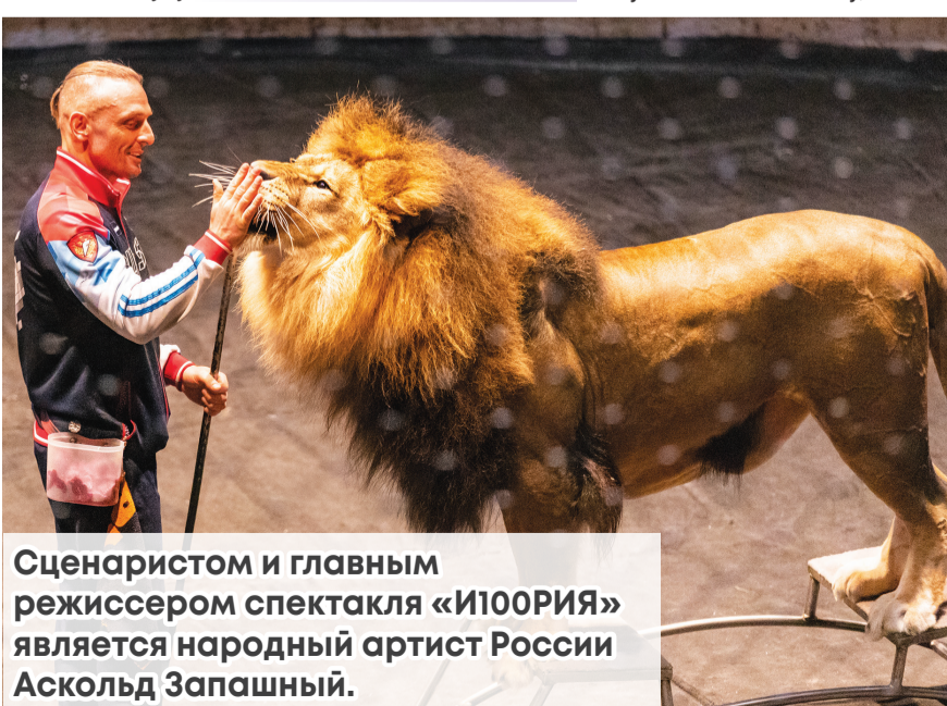
Сценаристом и главным режиссером спектакля «И100РИЯ» является народный артист России Аскольд Запашный.

И это была правда! Уже с началом первого представления львы и тигры, не снимая царственной короны с головы, пахали на арене так, что аплодисменты не смолкали ни на паузу!