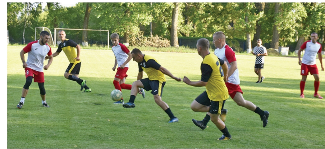
Подготовила Оксана ШЕВЧЕНКО

Основным местом почитания памяти бесстрашных героев является братская могила красных комиссаров, советских воинов и памятный знак в честь воинов-земляков, погибших в годы Великой Отечественной войны. Здесь же горит неугасаемый Вечный огонь, напоминающий о народном подвиге и ценности мира на земле.