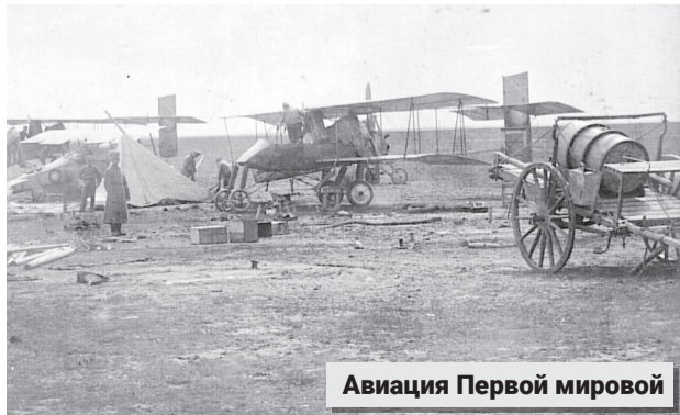
Авиация Первой мировой