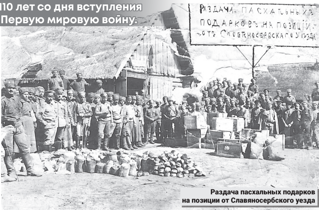
Раздача пасхальных подарков на позиции от Славяносербского уезда

Дал России своих героев в этой войне и провинциальный Луганск. В нашем городе были даже целые семьи людей беспримерного мужества.