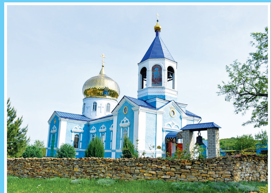
Восстановленный после обстрелов украинской армии храм в честь святого благоверного князя Александра Невского в селе Иллирии

Лутугинщина – край с вековой историей и культурой, земля тружеников полей, металлургов и шахтеров. Здесь, среди величественных терриконов и бескрайних степей, блещут купола старинных храмов и ниспадают рукотворные водопады. Приехав в Лутугино, любой турист обязательно выберется на экскурсию. И даже ограниченность во времени не помеха – конечно, за один день всех достопримечательностей не увидишь, но посетить интересные места вполне возможно.