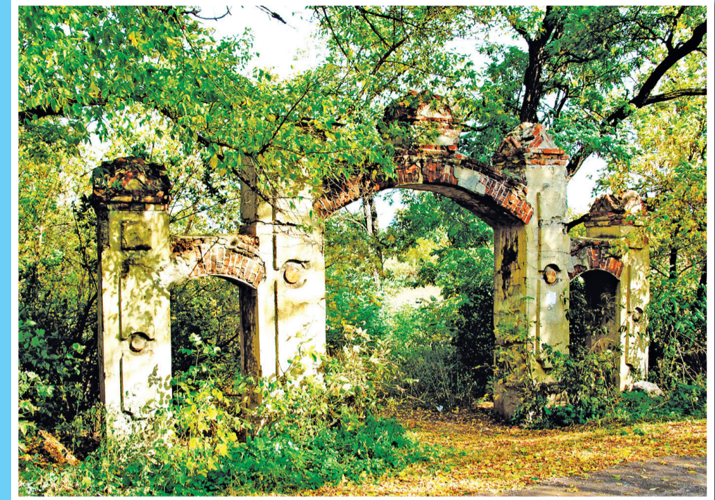
«Графские развалины» (руины усадьбы помещика Юрьева) в поселке Юрьевке