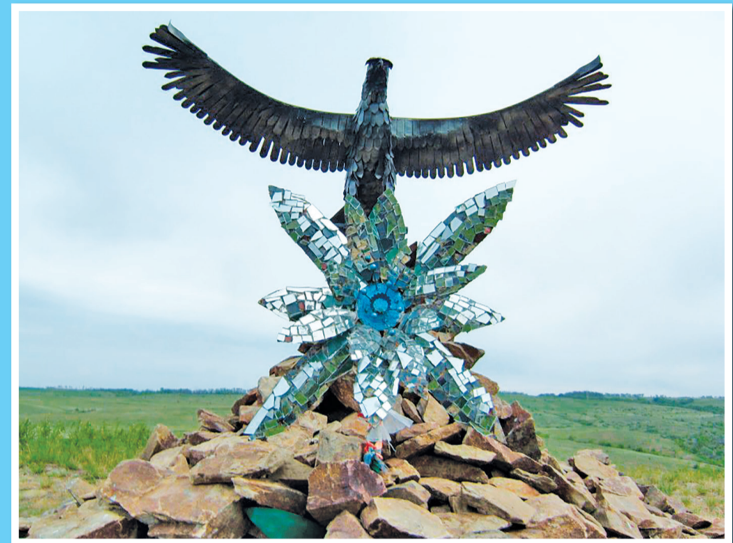
Монада инь-ян, выложенная из камней, кованный орел и цветок эдельвейс в селе Перовзвановке