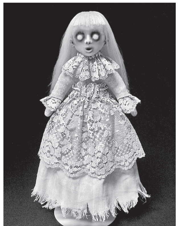
► Cecilia – мрачная, но миленькая

Cecilia – кукла-призрак, созданная художником Шейн Эрин (Shain Erin). Не торопитесь осуждать ее пугающий необычный облик. Во-первых, эта «красотка» не предназначена для детей. Во-вторых, по словам мастера, на его творчество оказывают влияние мифология, современная культура и мировое искусство, а куклы – это увлечение, с помощью которого он бросает вызов распространенным стереотипам и предвзятому мнению относительно искусства в целом. В третьих, бояться надо живых, и помнить, что судить по внешности о ком-либо – последнее дело. Да и вообще! Не мы ли в детстве зачитывались произведениями Гоголя или вздыхали над непростой судьбой кентервильского привидения Оскара Уайльда? И сохранили при этом здравый взгляд на мир, а главное – способность удивляться необычному.