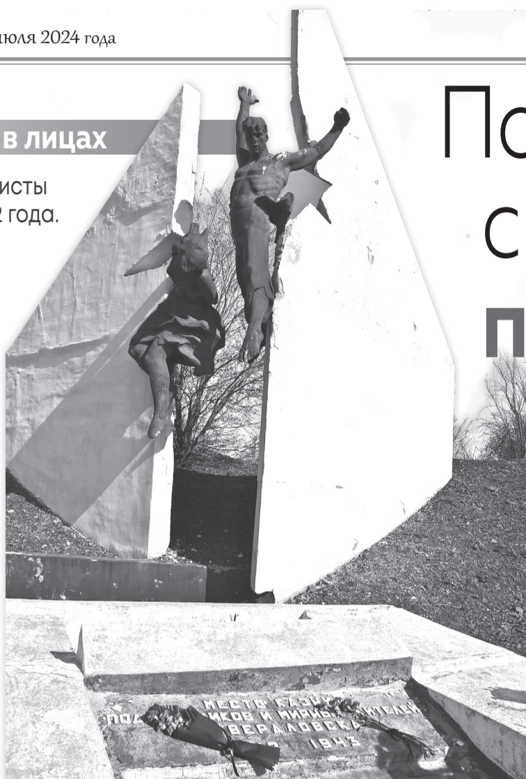
► Памятник на шурфе шахты № 23 – месте казни подпольщиков, мирных жителей и красноармейцев

В архиве Ворошиловградского обкома компартии хранятся сведения о подпольщиках нашего города и района. Этот документ размещен в свободном доступе на сайте «Молодая гвардия».