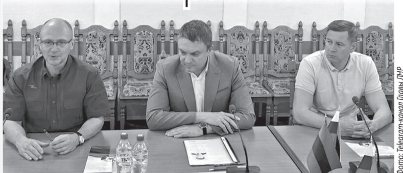
► Слева направо: Первый заместитель Руководителя Администрации Президента РФ Сергей Кириенко, Глава ЛНР Леонид Пасечник, Председатель Правительства ЛНР Егор Ковальчук

■ На очередном заседании Народного Совета Глава ЛНР Леонид Пасечник представил депутатам кандидатуру нового Председателя Правительства Луганской Народной Республики Егора Викторовича Ковальчука. Кандидатура нового Председателя Правительства была единогласно одобрена.