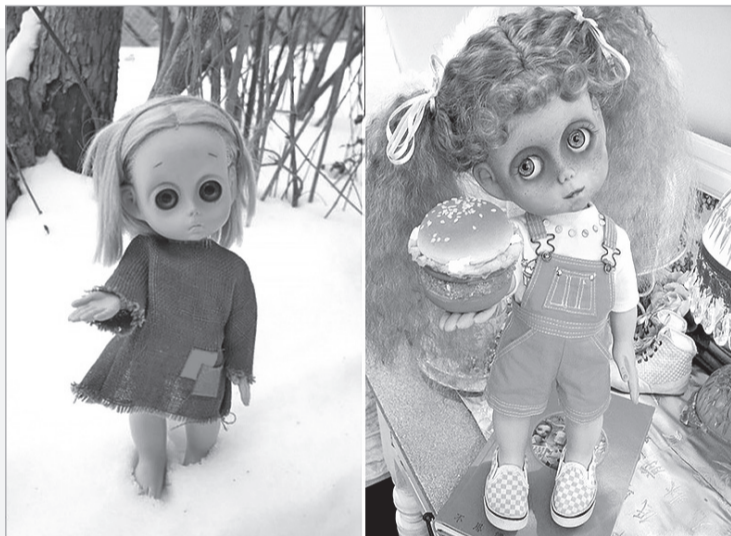
► Маленькая безымянная кукла: до и после преобразования

► Румянец Марибел – явный признак скорого выздоровления