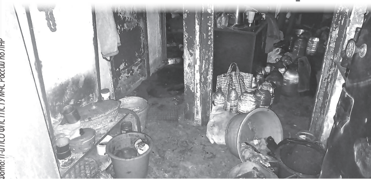
► Последствия пожара на ул. К. Либкнехта

8 июля в районе с. Зимовники горела лесополоса на площади 250 кв. м.