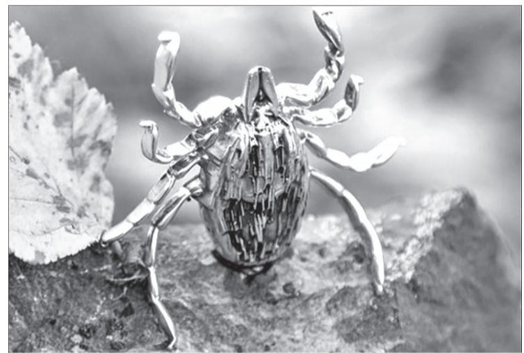
► Памятник клещу Валере в Уфе. Главный посыл арт-объекта – не нужно бояться делать прививку от энцефалита

При подтверждении укуса клеща следует срочно обратиться за назначением экстренной профилактики к инфекционисту по месту жительства.