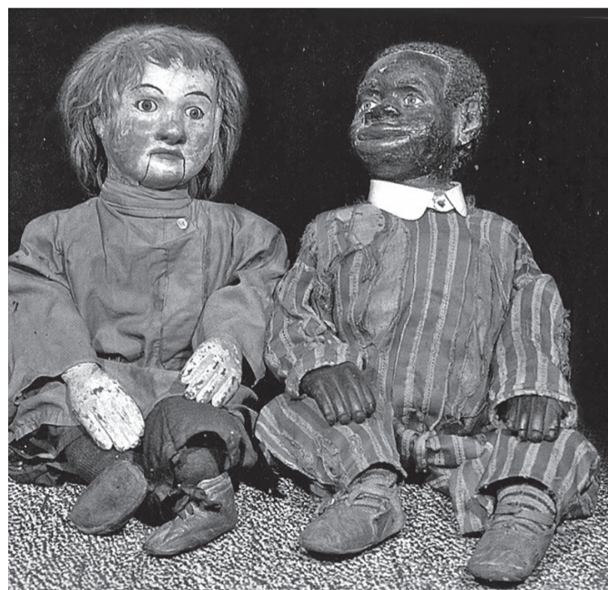
► Профессиональные актеры кукольного театра