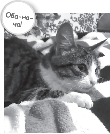
Оба-на-ча! ... Кошки научились видеть в темноте, потому что не достают до выключателя.