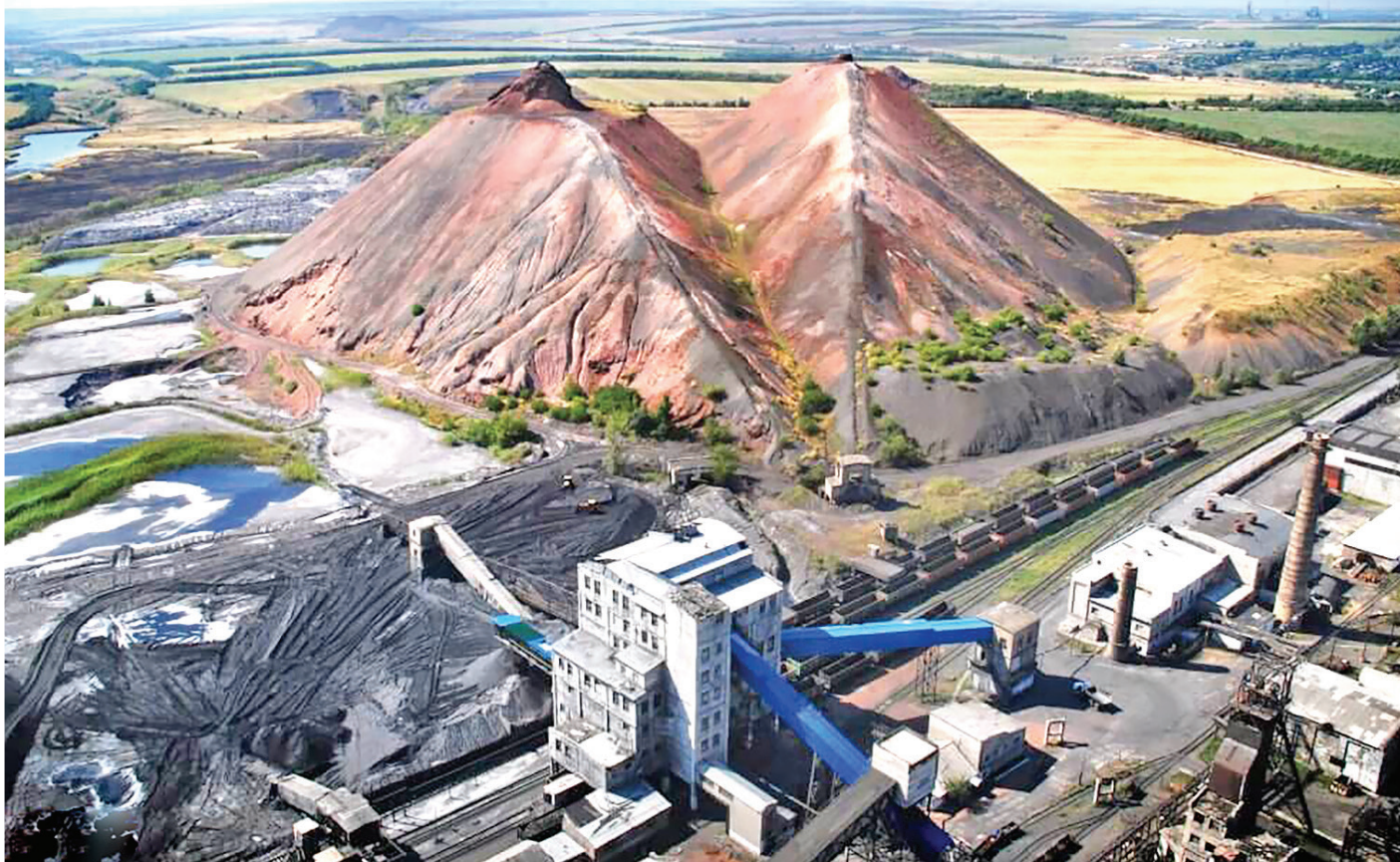
► Промплощадка шахты «Красный Партизан»