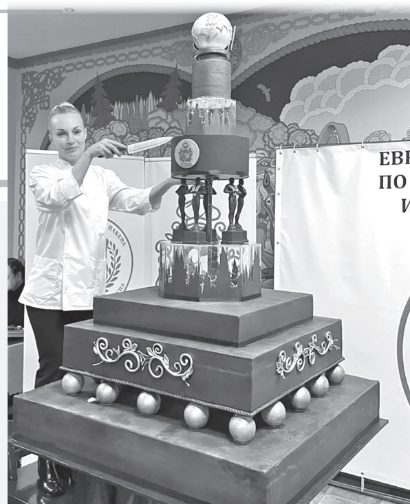
► Соревнования в Москве. Этот шоу-торт венчает шоколадный земной шар, который вертится вокруг оси. Произведение кондитерского искусства не проходило в двери, его пришлось разбирать и собирать заново.

Помимо конкурса, для участников фестиваля подготовили насыщенную программу: поездки на крокодиловую ферму, в королевский дворец, знакомство с местными обычаями, концерты в национальных колоритах... «Очень чистый, аккуратный город, идеальная дорога. Стиль жизни там совсем другой, люди никуда не спешат, – говорит наша победительница. – Очень доброжелательные, они принимали нас на высшем уровне. Хочется и в ЛНР организовать такие соревнования, и всех пригласить к нам».