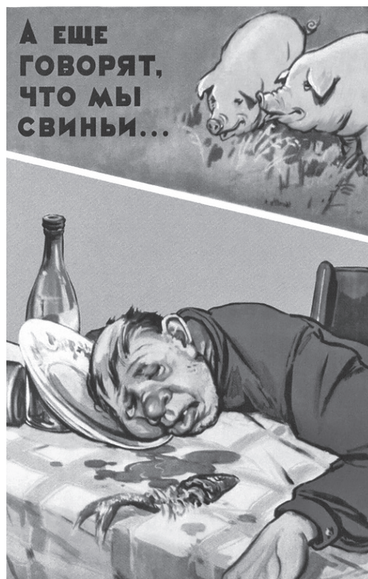
■ Советский антиалкогольный плакат 1985 года

Алкоголь, попадая в кровь, начинает с большой скоростью распространяться по всему организму. В первую очередь от спиртного страдают органы пищеварения. У больного начинаются резкие боли в области живота, развиваются гастрит, панкреатит, панкреонекроз, алкогольный цирроз печени, сахарный диабет, и нередко образуется рак желудка, который может привести к смерти. Алкоголь ведет к развитию заболеваний