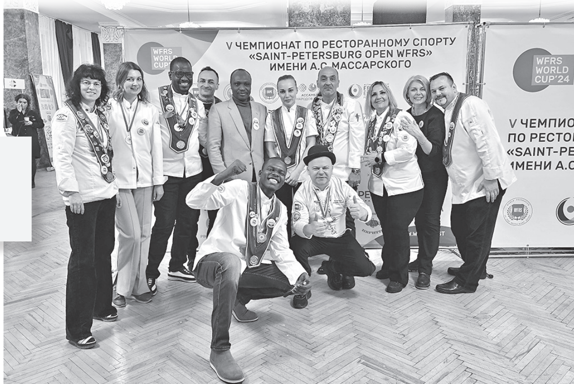
► На чемпионате в Санкт-Петербурге

Человек ответственный, она пришла на встречу за 10 минут до назначенного времени. Волосы собраны в строгую прическу – белоснежный китель кондитера обязывает – в сочетании со стройной фигурой похожа на гимнастку. Но стихия нашей собеседницы – ресторанный спорт, в котором она достигла больших успехов. Доказательство этому – многочисленные кубки и награды на красной ленте.