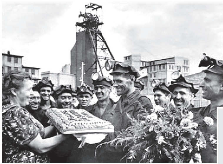
► Шахтеры Свердловска, 1960-е годы

ПМЭФ – важное событие не только для российского бизнеса. На форуме заключают соглашения и договариваются о сотрудничестве, делятся опытом, обсуждают экономические вопросы, проводят панельные дискуссии, круглые столы и бизнес-завтраки. Это возможность найти партнеров для развития бизнеса в России и за ее пределами, расширить круг заказчиков и поставщиков.