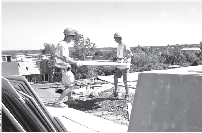
► Специалисты ООО «СтройТехМонтаж» выполняют капитальный ремонт мягкой кровли в кв. Пролетариата Донбасса

■ Красноярские строители приступили к капитальному ремонту мягкой кровли дома № 61 в квартале Пролетариата Донбасса: они уже выполнили частичный демонтаж старой кровли площадью 810 кв. м и приступили к монтажу нового покрытия. Специалисты рассказали, что сделают разуклонку для стока воды керамзитом, следом уложат два слоя цементно-стружечной плиты, а после огрунтовки – два слоя рулонной гидроизоляции.