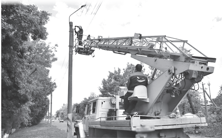
► Специалисты МУП «Горсвет» выполняют замену фонарей на ул. Лутугина

лампами: «Во-первых, они потребляют гораздо меньше энергии, что значительно экономит средства на освещение улиц. Во-вторых, светодиодные фонари имеют более длительный срок