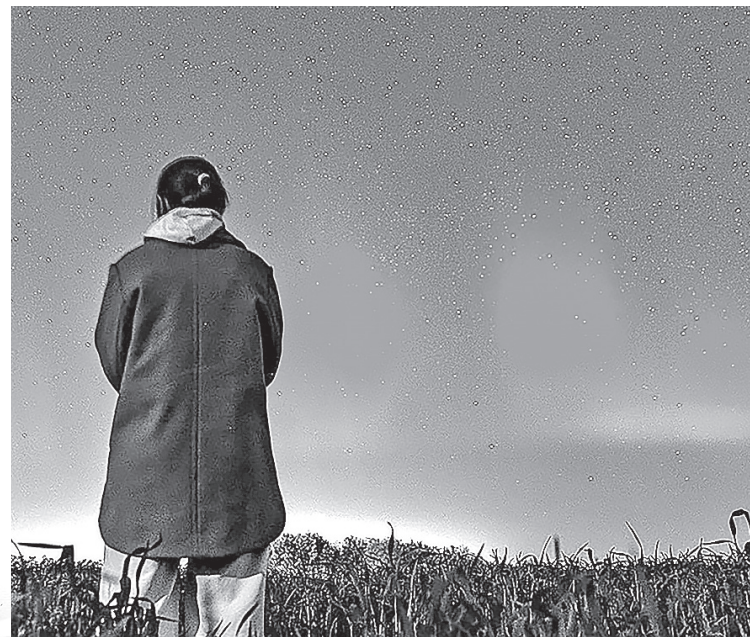
► Ростов-на-Дону. Северное сияние, которое возникло из-за сильной магнитной бури, начавшейся 10 мая.

Возможно, мы в самом деле «продырявили» одеяло, которое защищает нас от космической радиации, определяет электрический режим в воздухе и, в конечном счете, погоду. Тогда что и удивляться. Если это не мы, не люди, а само так, тогда еще страшнее: причин-то мы не понимаем.