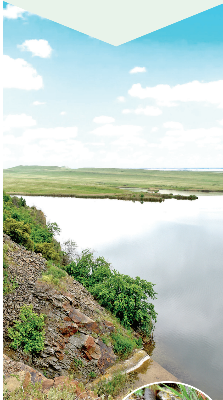
► Думаете, степь – это унылое пустое пространство, иногда разбавленное скачущим по своим делам перекасти-полем? А вот и нет. По территории Провальской степи протекают река Верхнее Провалье, ее приток река Калиновья, которые вместе с балками заповедника относятся к системе реки Большой Каменки – правого притока Северского Донца. Верхнее Провалье протекает по территории Калиновского участка. А в балке Грушевой расположен пруд Катарал.

Отделение Луганского заповедника «Провальская степь» создано Постановлением Совета Министров УССР от 22 декабря 1975 года с целью сохранения природных комплексов разнотравно-типчаково-ковылевых степей и байрачных лесов Донецкого края. Сегодня это удивительное место находится в числе объектов республиканского значения. Площадь двух почти равнозначных по территории участков Провальской степи – Калиновского и Грушевского – 587,5 га, и чего только нет на этой территории!