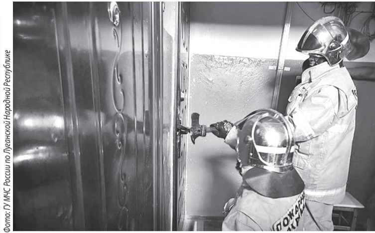
Фото: ГУ МЧС России по Луганской Народной Республике ► Спасательная операция: сотрудники МЧС открывают дверь квартиры

■ В службу 101 Свердловска поступил вызов от сотрудников полиции: в квартире многоэтажного дома заперта оказалась 4-летний ребенок. Мать вышла из квартиры, через минуту дверь оказалась заперта с внутренней стороны. Требовалась помощь спасателей.