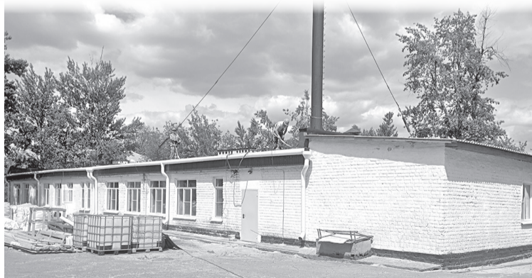
► Рабочие облагораживают кровлю мастерской СШ № 7

От 16 до 19 строителей во главе с руководителем бригады восстанов-