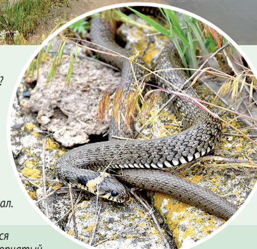
► Из пресмыкающихся здесь встречаются полозы – желтобрюхий, сарматский и узорчатый, ящерицы, гадюка степная, медянка обыкновенная, уж обыкновенный и водяной. Посмотрите, какой замечательный провальский ужик выполз взглянуть на прибывших в гости работников пера и клавиатуры!